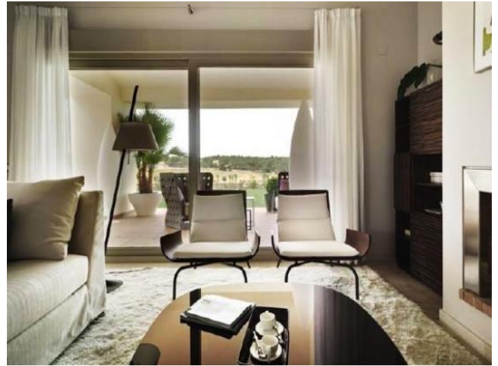
Wohnbereich mit Ausgang zum Balkon