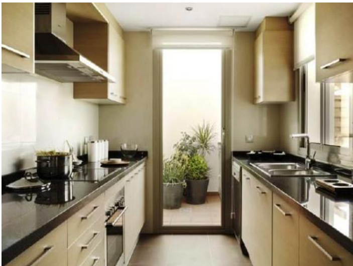
Komplett ausgestattete Küche