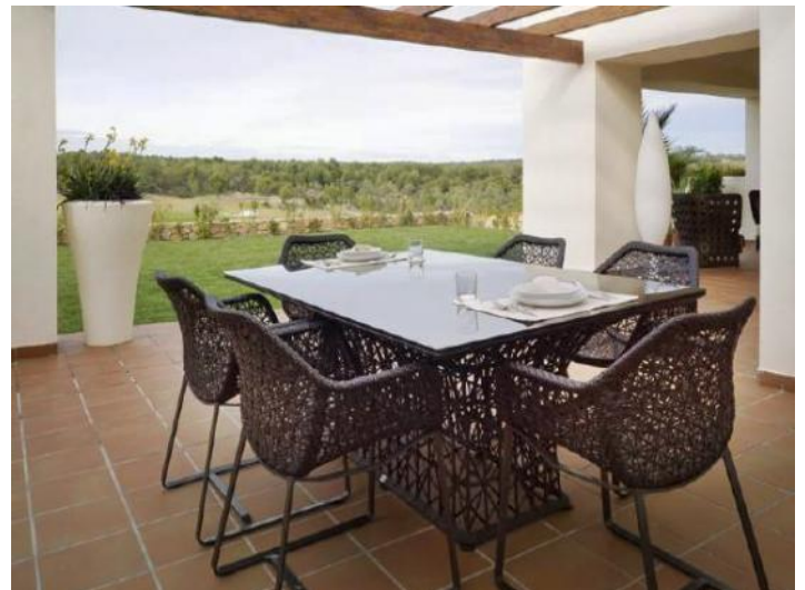
Terrasse mit Blick auf den Golfplatz