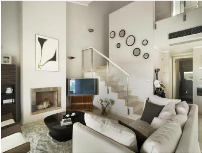
Wohnbereich mit kamin