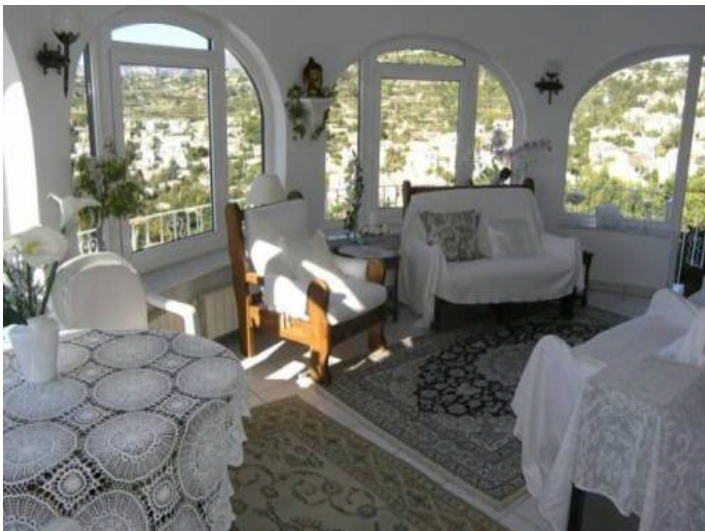
Helle Wohnfläche mit tollem Blick