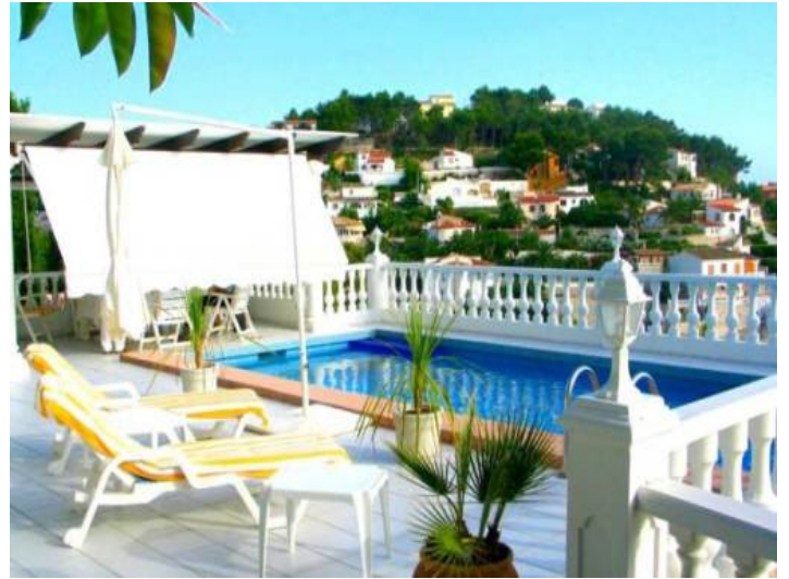
Pool und Terrasse