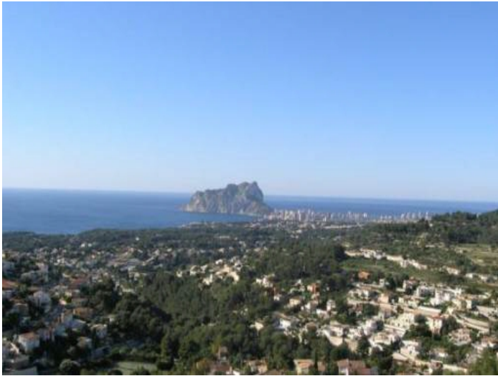
Spektakuläre Aussicht auf das Meer