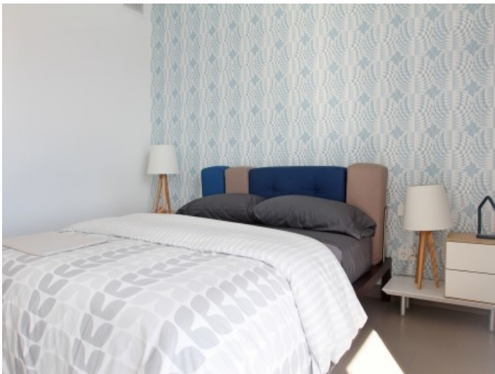
Schlafzimmer mit Doppelbett