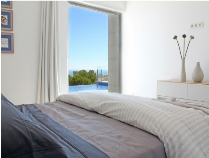
Schlafzimmer mit Meerblick