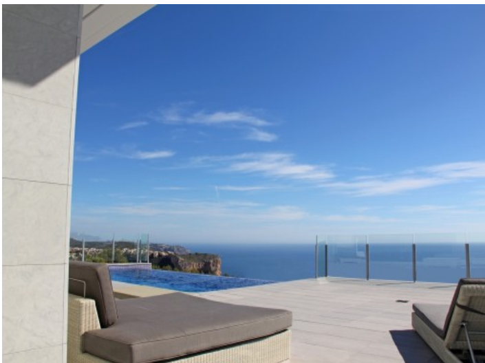
Puristische Terrasse mit eindrucksvoller Aussicht

Alle Angaben nach bestem Wissen. Irrtum und Zwischenverkauf vorbehalten. Dieses Exposé ist eine Vorinformation, als Rechtsgrundlage gilt allein der notariell abgeschlossene Kaufvertrag.