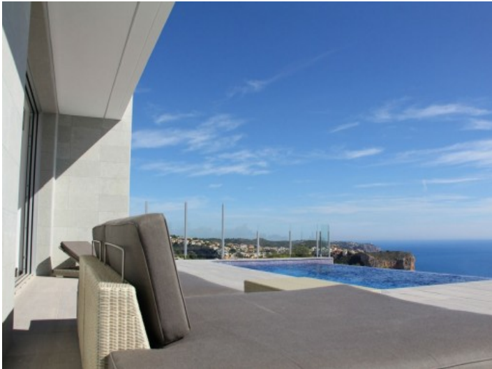
Exklusiver Poolbereich mit traumhaftem Meeresblick