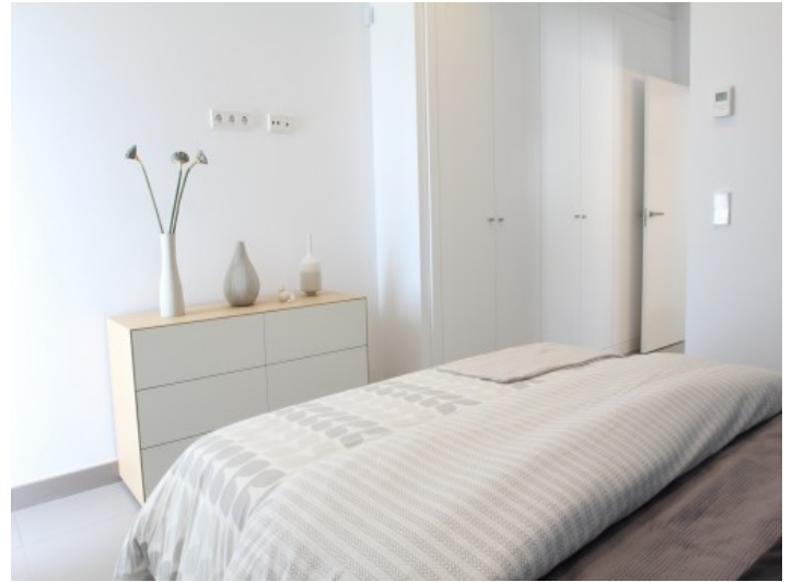
1 von 3 Schlafzimmern