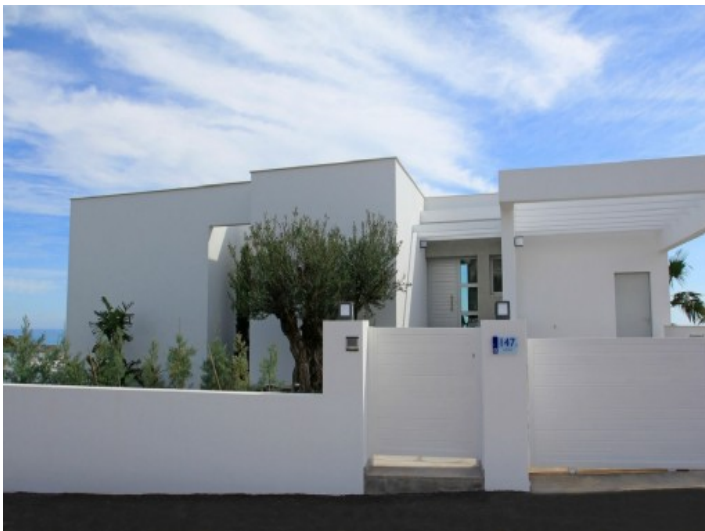
Imposanter Eingangsbereich der Villa