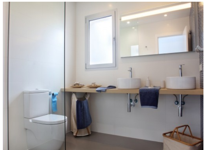
Exklusives Badezimmer mit Doppelwaschbecken

Alle Angaben nach bestem Wissen. Irrtum und Zwischenverkauf vorbehalten. Dieses Exposé ist eine Vorinformation, als Rechtsgrundlage gilt allein der notariell abgeschlossene Kaufvertrag.