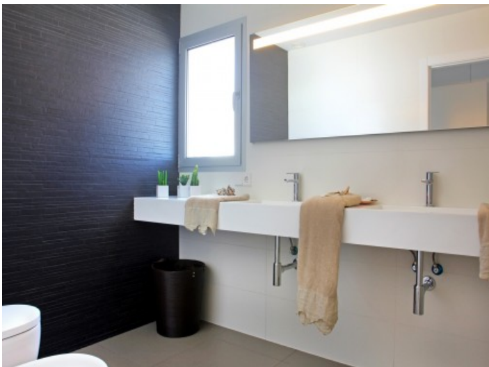
1 von 2 Badezimmern