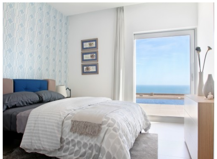
Schlafzimmer mit direktem Zugang zum Poolbereich

Alle Angaben nach bestem Wissen. Irrtum und Zwischenverkauf vorbehalten. Dieses Exposé ist eine Vorinformation, als Rechtsgrundlage gilt allein der notariell abgeschlossene Kaufvertrag.