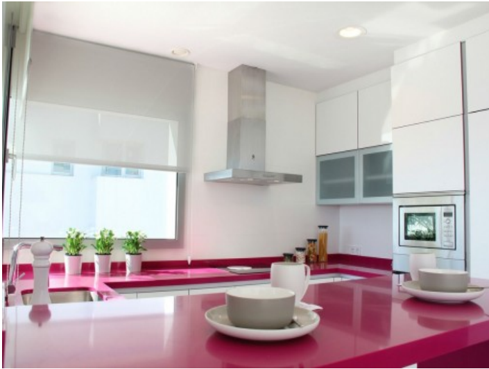
Vollausgestattete Küche in außergewöhnlichem Design