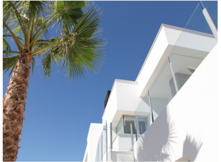
Außenansicht der Villa