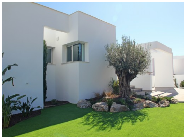
Pflegeleichte Garten- und Rasenflächen