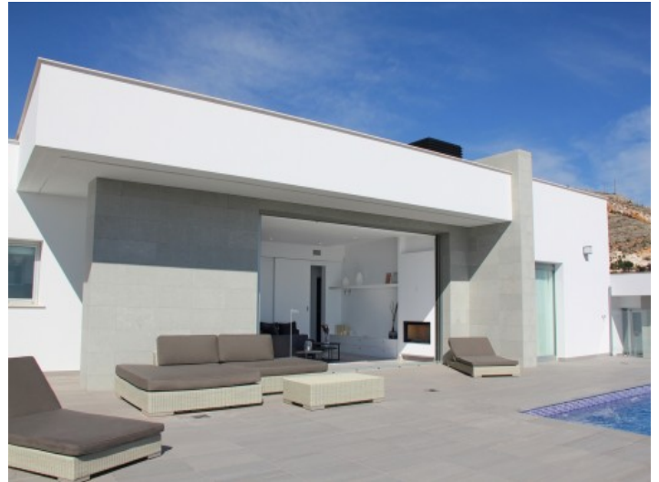
Großer Poolbereich mit Loungemöbeln