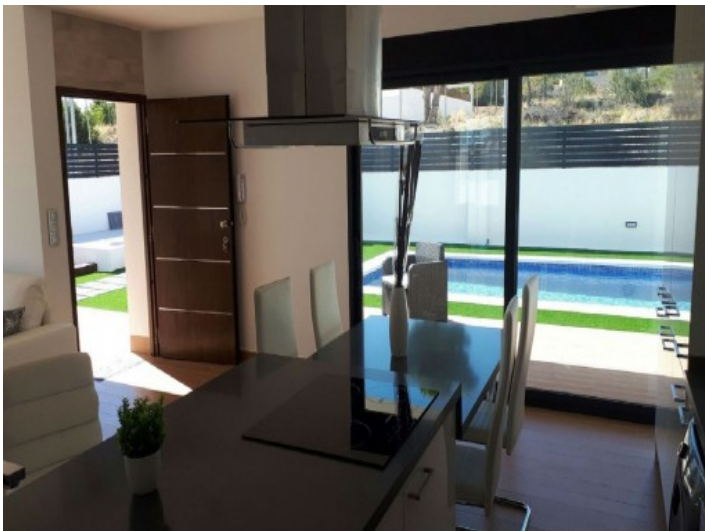
Wohnzimmer mit Zugang zum Poolbereich