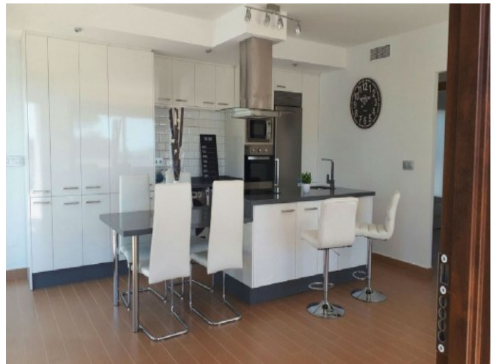
Modernes und helles Wohnzimmer