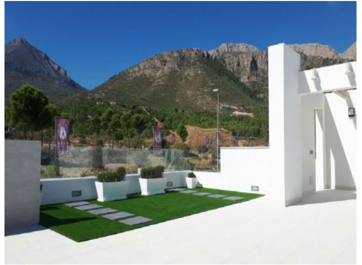
Garten mit Blick auf die umliegenden Berge