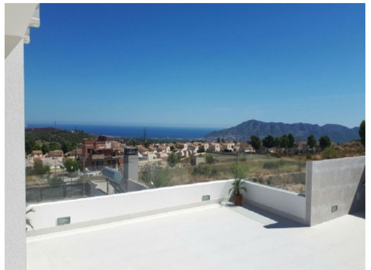
Dachterrasse mit Blick auf das Meer

Alle Angaben nach bestem Wissen. Irrtum und Zwischenverkauf vorbehalten. Dieses Exposé ist eine Vorinformation, als Rechtsgrundlage gilt allein der notariell abgeschlossene Kaufvertrag.