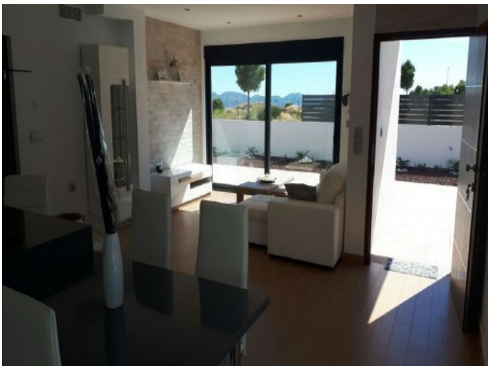
Gemütliche Sitzecke im Wohnzimmer