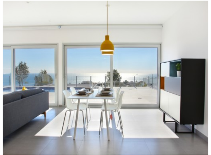
Helles Wohnzimmer mit direktem Terrassenzugang