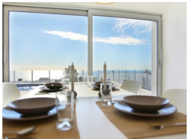
Essbereich mit Blick auf das Meer

Alle Angaben nach bestem Wissen. Irrtum und Zwischenverkauf vorbehalten. Dieses Exposé ist eine Vorinformation, als Rechtsgrundlage gilt allein der notariell abgeschlossene Kaufvertrag.