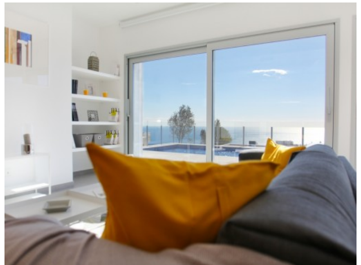
Wohzimmer mit Blick auf den Pool