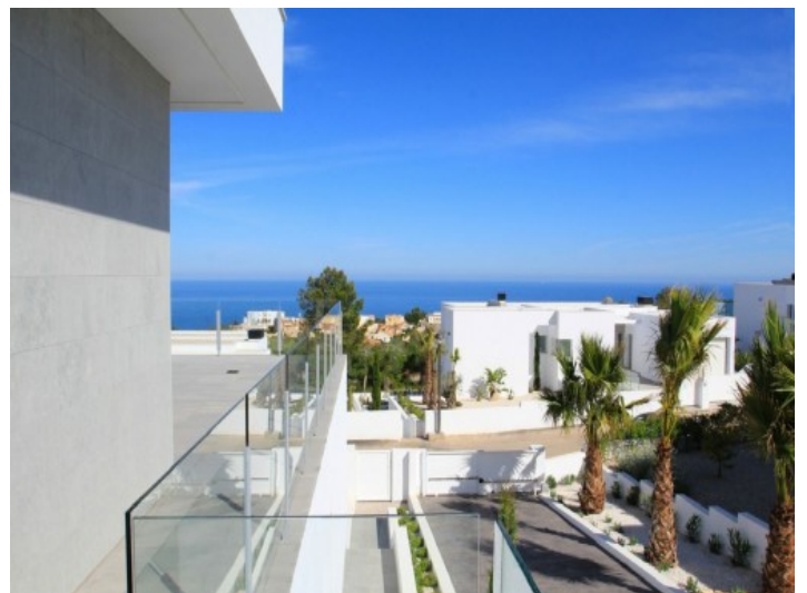
Beeindruckende Aussicht auf das Meer