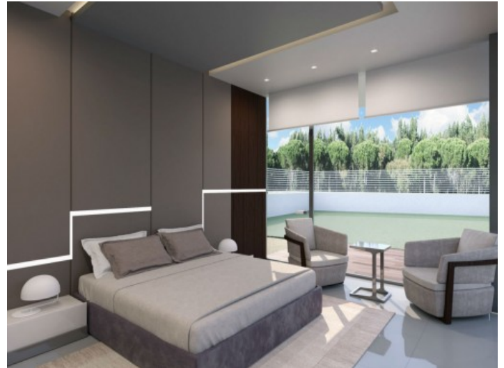
Hauptschlafzimmer mit ansprechendem Ausblick