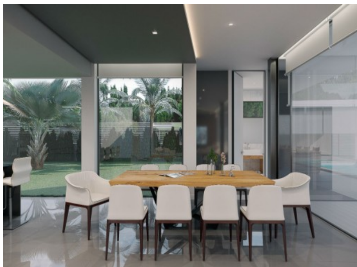
Blick in das geschmackvoll eingerichtete Esszimmer