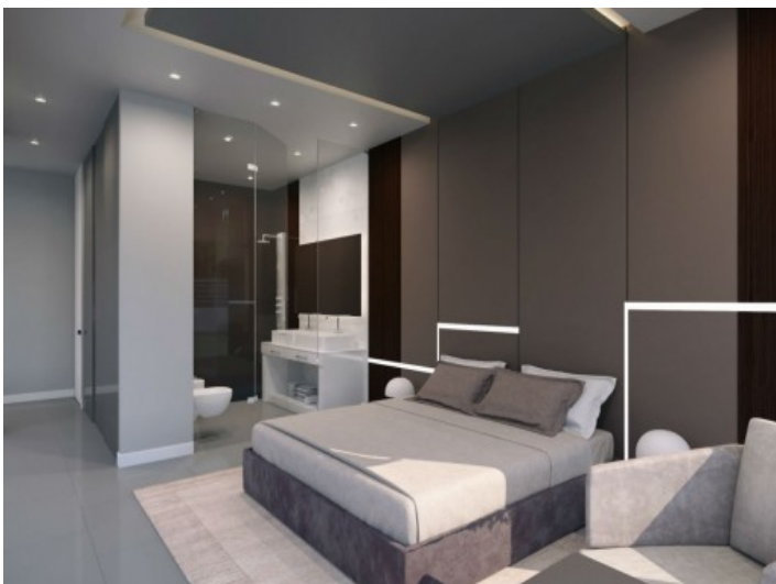
Weiteres Schlafzimmer mit Badezimmer en suite