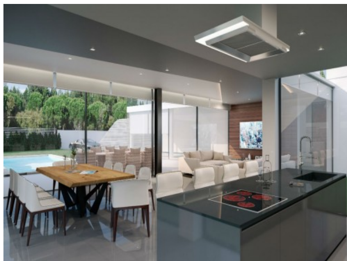
Neumodische und voll ausgestattete Küche

Alle Angaben nach bestem Wissen. Irrtum und Zwischenverkauf vorbehalten. Dieses Exposé ist eine Vorinformation, als Rechtsgrundlage gilt allein der notariell abgeschlossene Kaufvertrag.