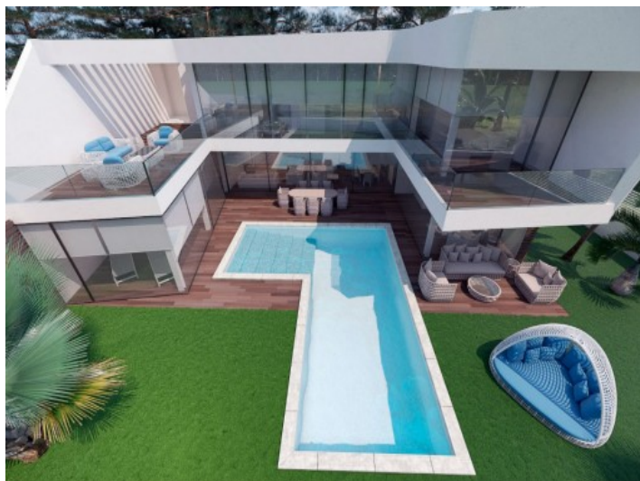
Außenansicht der luxuriösen Villa