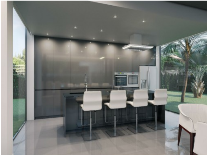
Mondäne Bar in der Küche