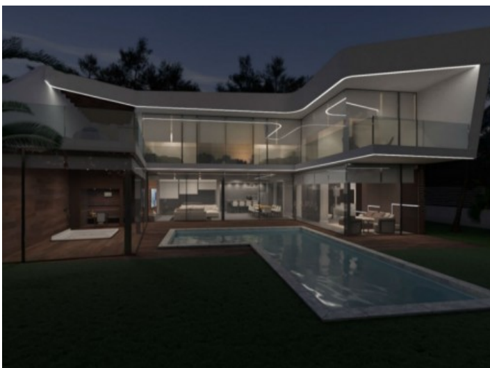
Blick auf die Villa bei Nacht

Alle Angaben nach bestem Wissen. Irrtum und Zwischenverkauf vorbehalten. Dieses Exposé ist eine Vorinformation, als Rechtsgrundlage gilt allein der notariell abgeschlossene Kaufvertrag.