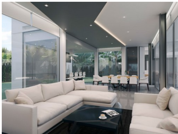
Blick vom Loungebereich in den Essbereich