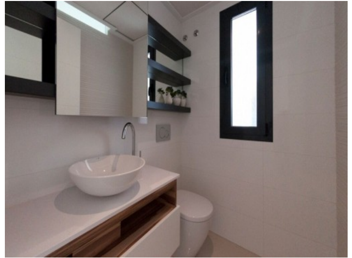
Badezimmer mit Tageslicht