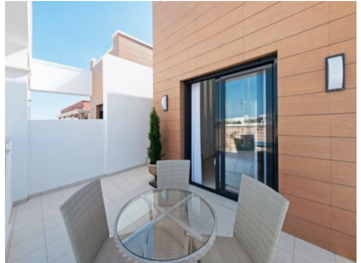
Großzügig geschnittene Terrasse mit hochwertigen Gartenmöbeln