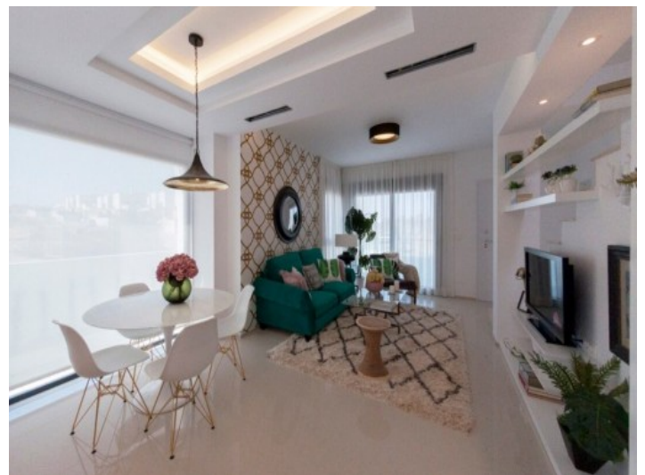
Lichtdurchfluteter Wohn- und Essbereich