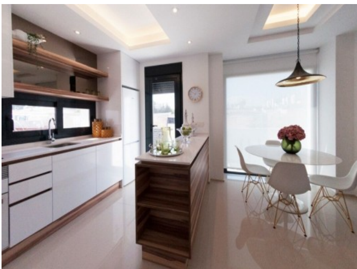
Voll ausgestattete Küche mit angrenzendem Essbereich