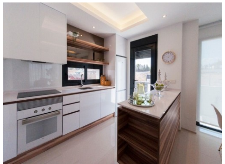
Küche mit direktem Terrassenzugang

Alle Angaben nach bestem Wissen. Irrtum und Zwischenverkauf vorbehalten. Dieses Exposé ist eine Vorinformation, als Rechtsgrundlage gilt allein der notariell abgeschlossene Kaufvertrag.