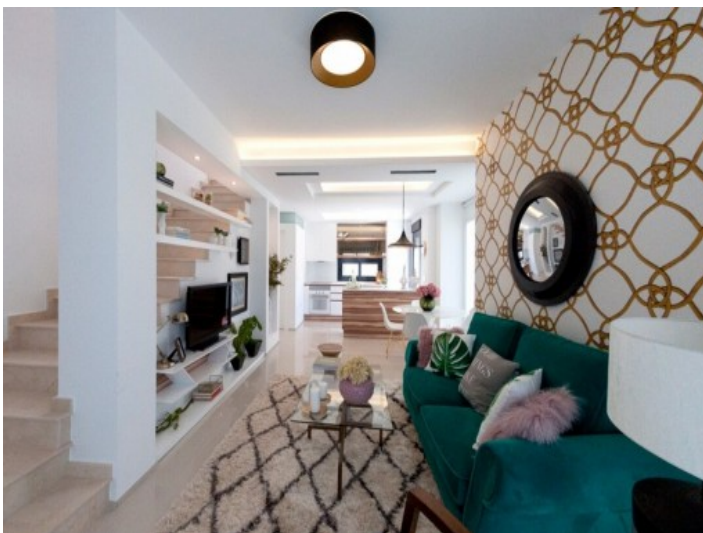
Stilvoll eingerichteter Wohnbereich mit Treppenaufgang