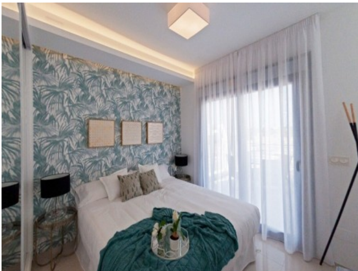
Weiteres Schlafzimmer mit angrenzender Terrasse