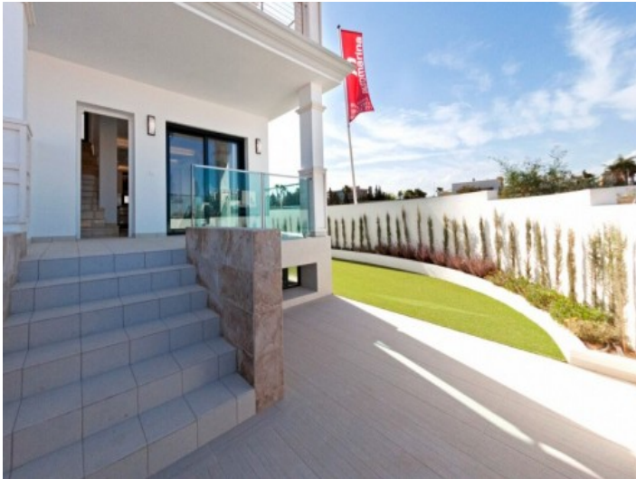
Einladender Eingangsbereich mit Blick auf den Garten