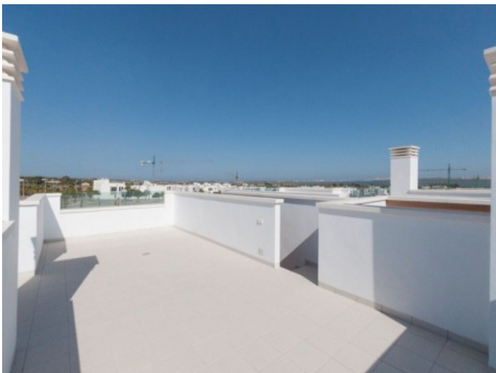
Große Dachterrasse mit atemberaubendem Blick auf die umliegende

Umgebung Alle Angaben nach bestem Wissen und Gewissen. Zwischenverkauf vorbehalten. Dieses Exposé ist eine Vorinformation, als Rechtsgrundlage gilt allein der notariell abgeschlossene Kaufvertrag.