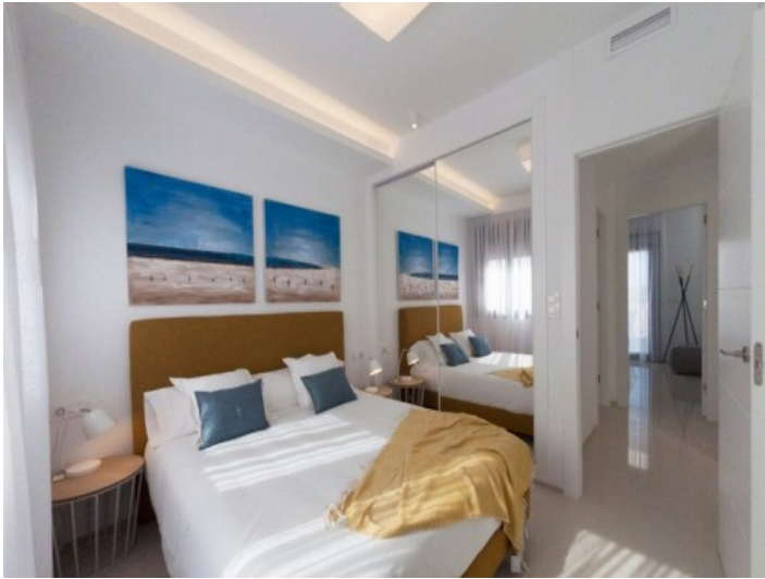
Geräumiges Schlafzimmer mit Einbaukleiderschrank