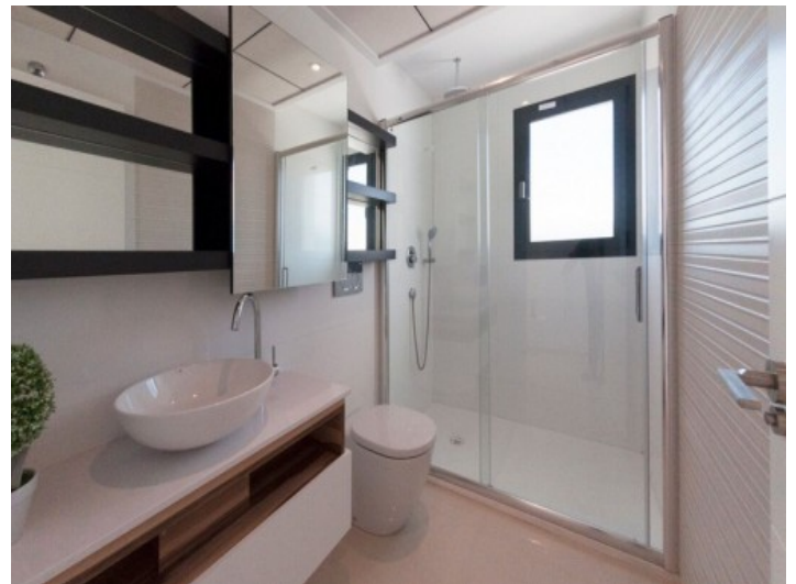
Helles Badezimmer mit Regendusche