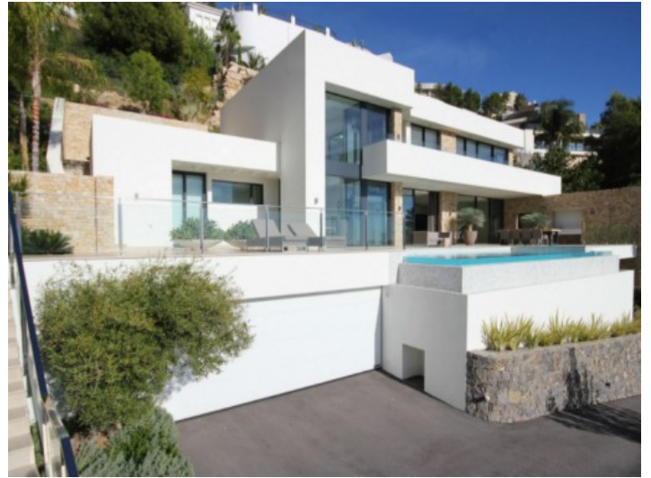
Vorderansicht der modernen Villa mit Garage

Alle Angaben nach bestem Wissen. Irrtum und Zwischenverkauf vorbehalten. Dieses Exposé ist eine Vorinformation, als Rechtsgrundlage gilt allein der notariell abgeschlossene Kaufvertrag.