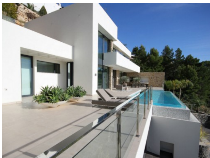
Blick vom Treppenaufgang zum Pool