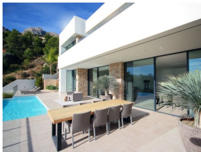
Großzügig geschnittene Sonnenterrasse