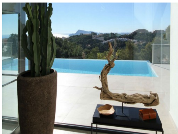
Blick von Wohnbereich zum Pool

Alle Angaben nach bestem Wissen. Irrtum und Zwischenverkauf vorbehalten. Dieses Exposé ist eine Vorinformation, als Rechtsgrundlage gilt allein der notariell abgeschlossene Kaufvertrag.