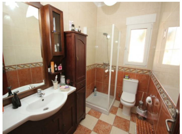
1 von 2 Badezimmern