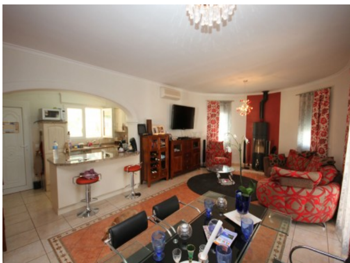
Offenes Wohnzimmer mit integrierter Küche