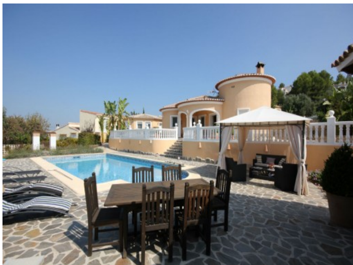
Pool mit mehreren Sitzmöglichkeiten