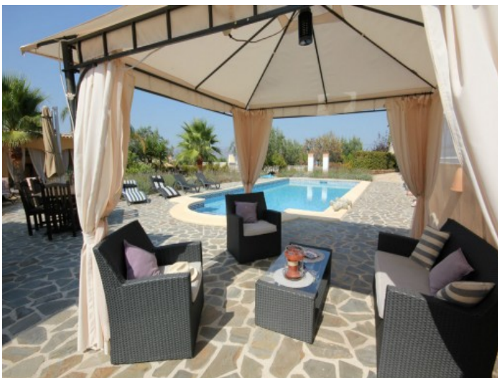
Überdachte Lounge am Pool