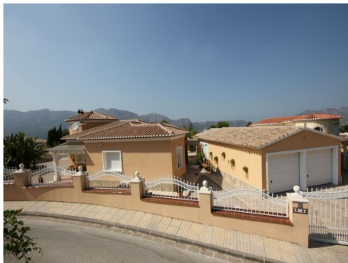
Frontansicht Eingang und Garage