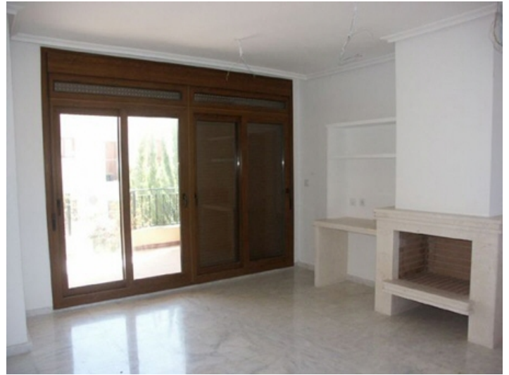
Wohnbereich mit Kamin und Zugang zur Terasse