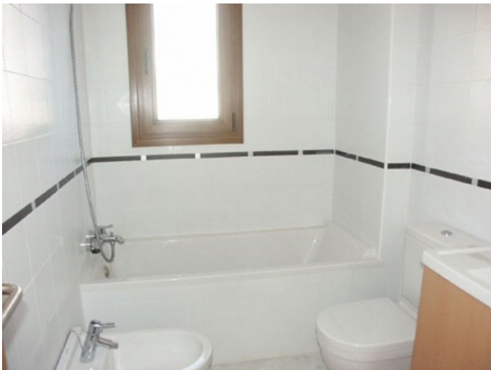
Bad mit Badewanne